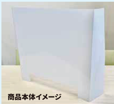
商品本体イメージ